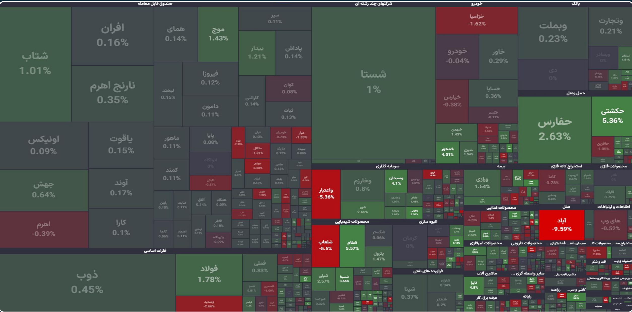
صندوق قابل معامله